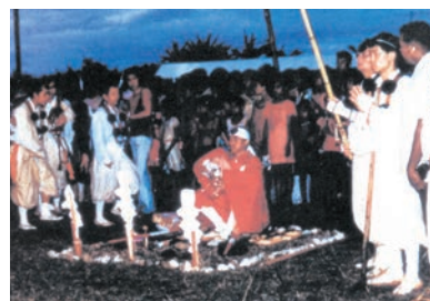
南太平洋・平和の祈り大柴燈護摩供 / パラオ諸島・コロール島(1977.04)