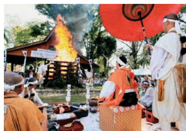
南太平洋・ガダルカナル大柴燈護摩供 / ソロモン諸島国ホニアラ ニューギニア護摩法要 / ウェワク(2009.10)