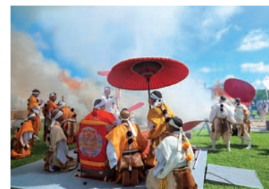
世界平和祈念 神仏両界沖繩大柴燈護摩供 / 糸満市・沖繩平和祈念公園(2015.11)