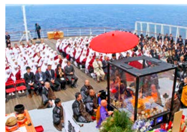
太平洋戦争戦没者成仏供養 洋上法要 / 硫黄島沖・フィリピン沖・東シナ海(2012.05)