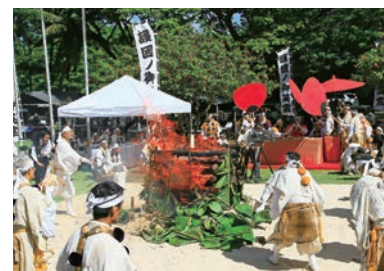
マリアナ諸島戦没者成仏供養 サイパン・テニアン大柴燈護摩供 / サイパン島・テニアン島(2014.11)