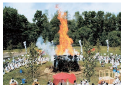
抑留犠牲者成仏供養・シベリア大柴燈護摩供 / ロシア・ハバロフスク市(2007.07)