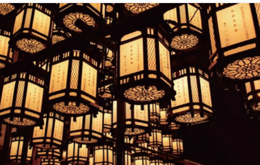
総本殿回廊に掲げられた大万燈