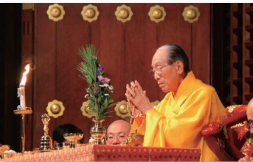
総本殿向拝における阿含宗管長 桐山靖雄大僧正奉修の法要