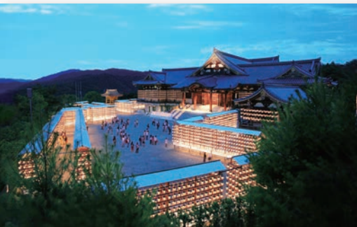
夕暮れの中、総本殿境内地に灯る万燈