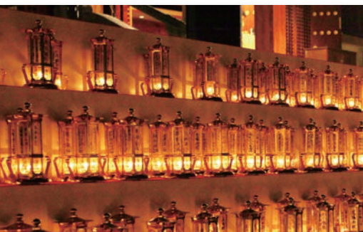
諸願成就を祈る御聖火塔