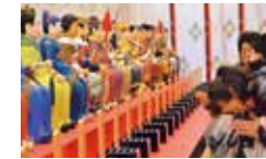
六十星宿守護神将