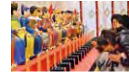
六十星宿守護神将